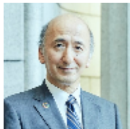
中曽宏前日銀副総裁

日本銀行の次期総裁として現在本命視されているのは、雨宮正佳副総裁と中曽宏大和総研理事長(元日銀副総裁)です。現時点では雨宮氏が有力視されていますが、当の雨宮氏は消極的な意思を示しています。雨宮氏は金融政策に関する深い知識と豊富な経験、そして財政当局との信頼関係などがあります。