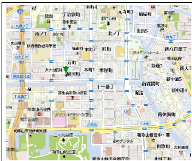
和歌山市駿河町47番地

住宅地の変動率は全国38位(昨年42位)、商業地は全国32位(28位)で近畿2府4県では住宅地、商業地とも最下位です。商業地では継続調査した43地点のうち和歌山市内の6地点で上昇、上昇地点があるのは2年ぶりで最も上昇率が高かったのは市中心部にあり、中低層の店舗や事務所が混在する「和歌山市駿河町47番」で0.9%(千円)上がり11万5千円となっています。住宅地での価格最高地点は10年連続で「和歌山市吹上4-2-36」で坪単価195,000円/m 2 です。