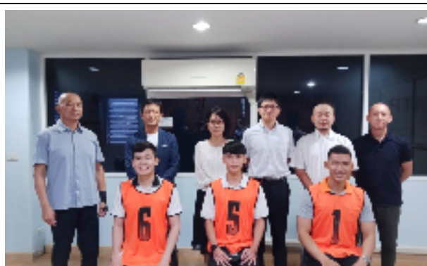
合格した実習生たち