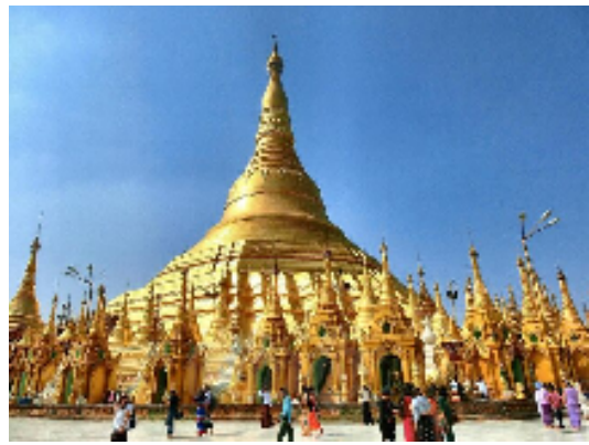
シュエダゴンパゴダ (ヤンゴン)