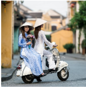
アオザイを着た女性

国民性は長らく中国の植民地であった性か、中国人の縮図と言って過言ではありません。