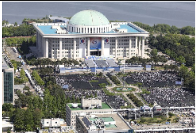
青瓦台・国会議事堂前