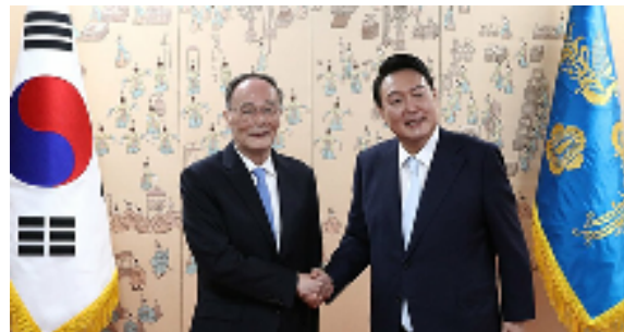
中国副王岐山主席と