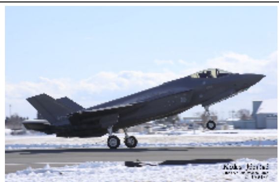
F 35A ステルス戦闘機