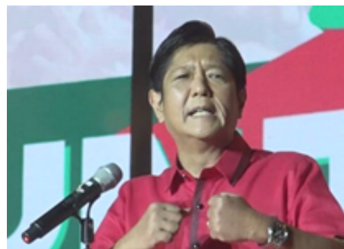
マルコス次期大統領