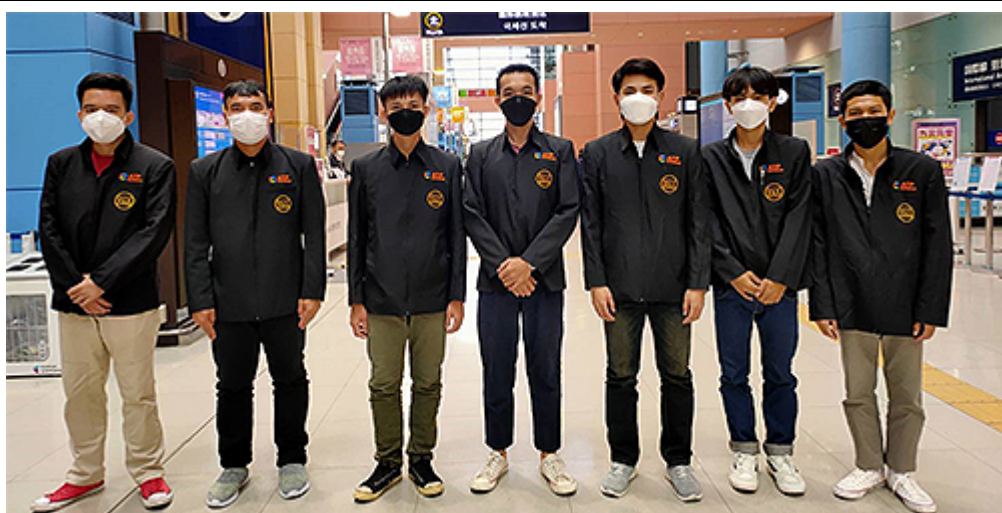
タイから来日した技能実習生達、寮で待機期間を終え 約1ヵ月間に渡り当組合の専属講師より日本語の講習を受けます