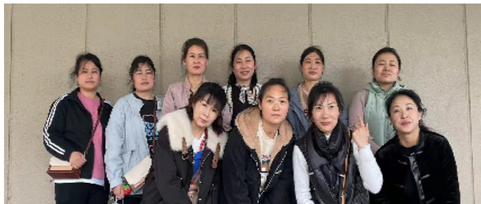
中国から来日し7日間の待機期間を終了した10名の特定技能生達

4月には22名の技能実習生と特定技能実習生が来日予定ですが、今年4月から入国者数の上限が1万人に緩和されることもあり、来日人数も更に増える予定で期待しています。