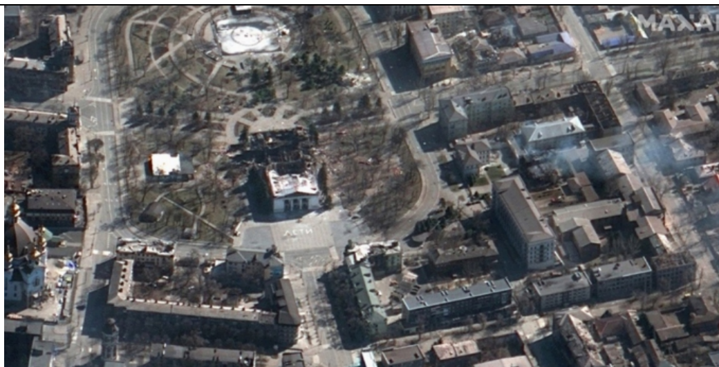
空爆を受けたマリウポリの劇場跡