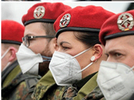
シュルツ首相とドイツ軍

長らく軍備に慎重だったドイツでも例外ではありません。攻防費を国民総生産(GDP)比2%以上(日本は1.25%)の2倍と大幅に引き上げ、1,000億ユーロ(日本円約13兆円)にすると表明しました。