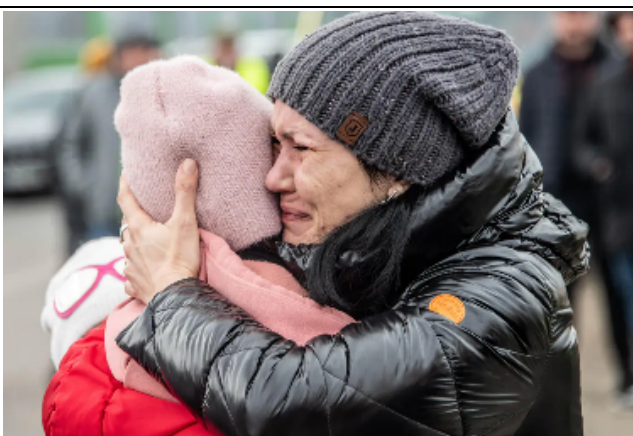
ポーランドに避難する人々