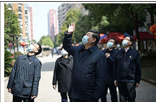
3月10日 武漢訪問の習近平主席

隠蔽や先延ばしが原因で感染拡大に繋がったことに間違いはありませんが、新華社通信(中国政治の活動団体)が「世界は中国に感謝すべき」とまで世界の常識とかけ離れており、厚顔無恥とは正にこの事でしょう。仮にこれが日本だったら世界に平身低頭に謝っているでしょう。