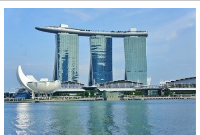
シンガポール：マリーナベイサンズ

シンガポールと言えば何を想像します？ マーライオン、カジノ、マリーナベイサンズが思い浮かぶでしょう。かつてアイドルグループがCM撮影をして空中にプールがあるように見える事が話題となり知られる事になったマリーナベイサンズ、読者の中には行った事がある方もいらっしゃると思います。このマリーナベイサンズですが、以前から傾いていると噂がありました。真実かデマかは不明ですが、3つのビルが船を支えているといった57階建て、高さ200mの建物です。