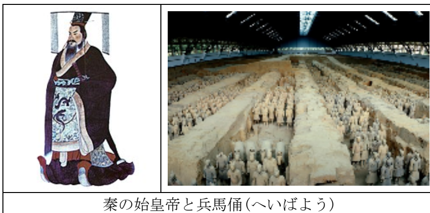
秦の始皇帝と兵馬俑(へいばよう)

中国を初めて統一した秦(現在の西安)の始皇帝は北の遊牧民族の良いところと、農耕民族の良さを兼ね備えたのです。言い換えれば遊牧民の勇敢さと食料小麦が兼ね備えられたので、これが中国を統一に結び付けたのです。