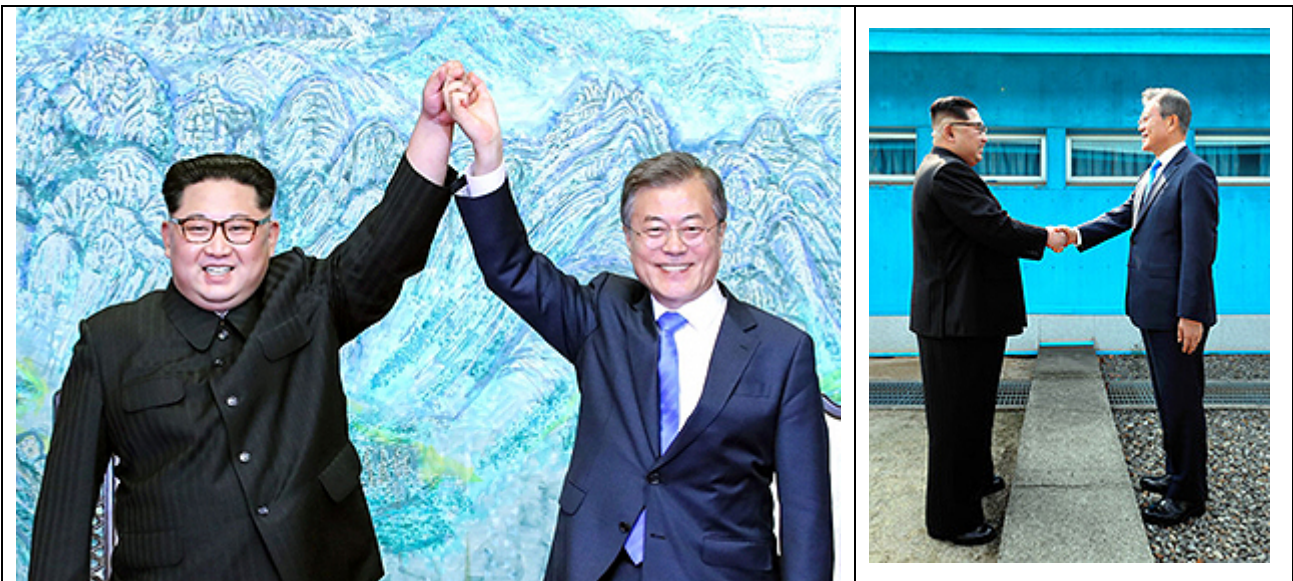
北朝鮮 金正恩朝鮮労働党委員長と韓国 文在寅大統領

写真は4月27日、南北軍事境界線がある板門店で開かれた首脳会談に出席した時に撮影されたもので、南北首脳会談は10年半ぶりで軍事境界線を挟み握手する両者の様子が撮影されています。イメージを非常に大切にしている韓国主導の下に進められているのですが、跨いで超えられる