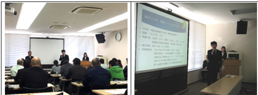
外国人実習生受入れセミナー会場にて

当組合からの受入れを、このように評価して頂き、大変嬉しく思います。 ありがとうございました。