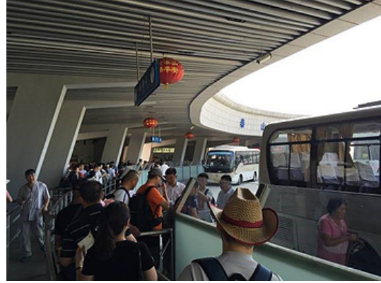
泰山登頂～登山口までバスに乗り移動(30分) ※片道100元