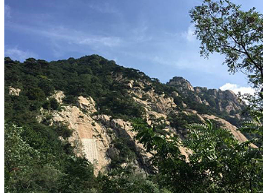
登山道ではなく石階段が最後まで続き、所々の壁面に彫刻があり綺麗