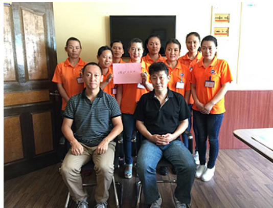
今回の合格者の一部の女性でした