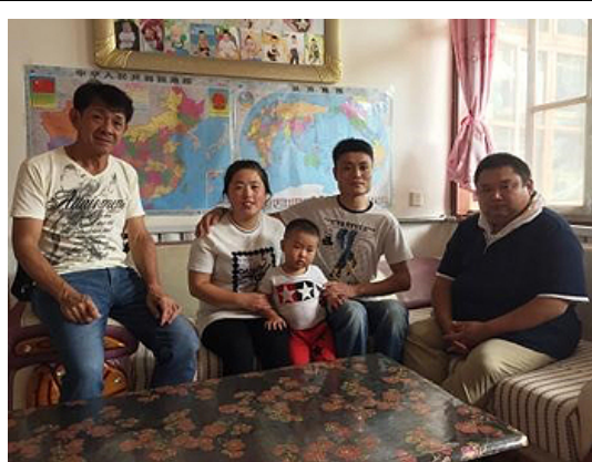
合格者の家庭を訪問して、その生活状況を把握