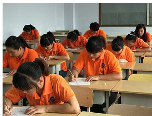
筆記試験、算数の問題を間違わずに10分で解く事が出来るかどうか