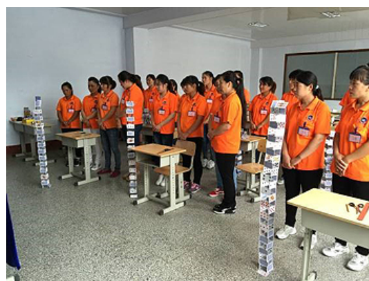
工作組立のテストとトランプタワーを作る器用さテスト