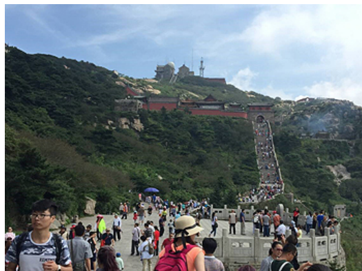
山頂付近の様子、多くの観光客で賑わっています

アジアに関する情報、ご意見、ご相談、またはご意見等々お待ちしております。 投稿先：info@ibia.or.jp