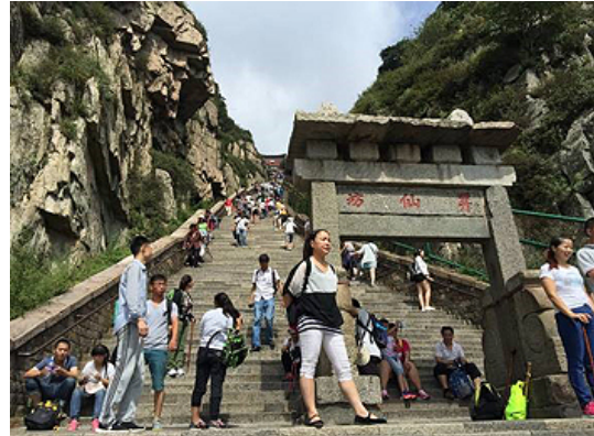
多くの観光客と物品を運ぶ人達