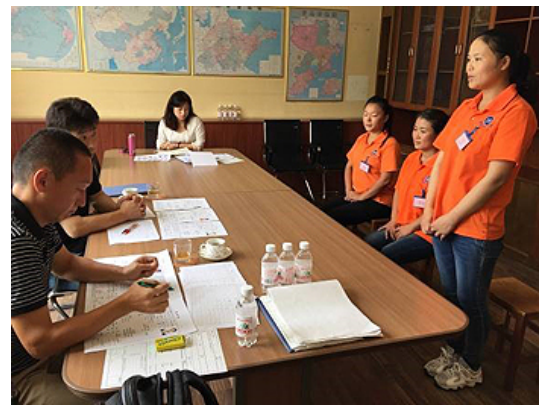
指先が清潔かどうか手先を見る検査