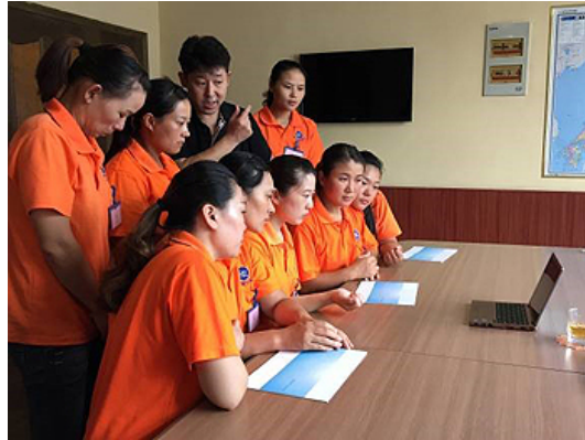
合格者には会社の実際の状況を動画とパンフで説明 安心して来日出来るように…