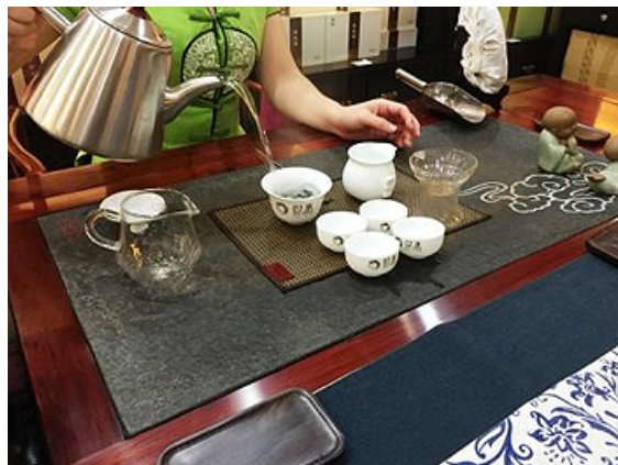
特別なお客様にしか出さない高級料理のセミの唐揚げと 中国式のお茶の入れ方